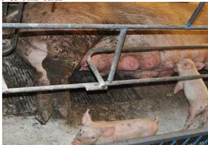
Leitões na maternidade mamando em fêmea com aparelho mamário e posterior sujo de fezes - Fonte: Alan Jones - MercoLab

Fonte: Diarréia em leitões: como prevenir – Dra. Jose-te Bersano, Instituto Biológico de São Paulo.